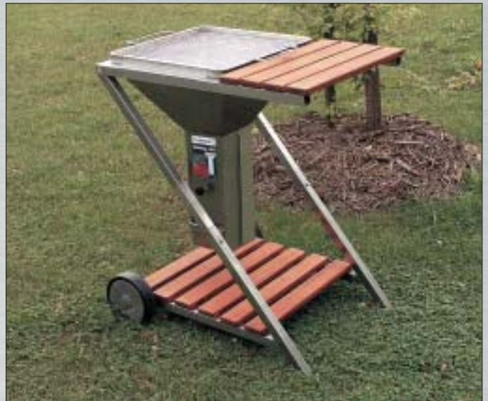
THÜROS Amrum Art.-Nr. GST 4242 EHZ EAN-Nr. 4021899 50447 5