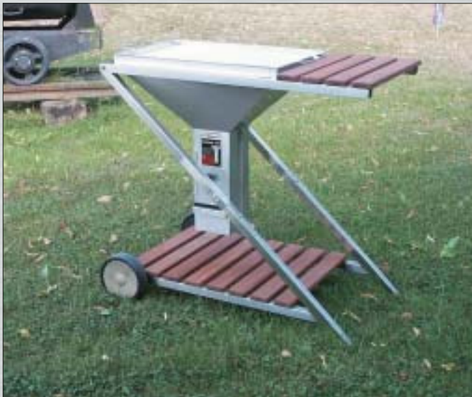
THÜROS Sylt Art.-Nr. GST 4060 EHZ EAN-Nr. 4021899 50444 4