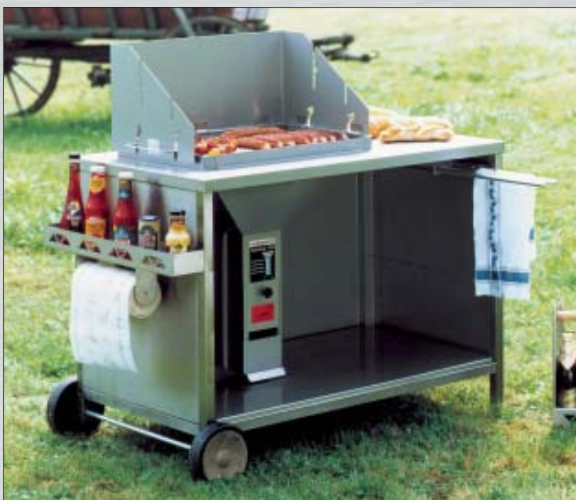
Exklusive Grillstation THÜROS II fahrbar, Edelstahl

Art.-Nr. EGST 4060 F EAN-Nr. 4021899 04184 0