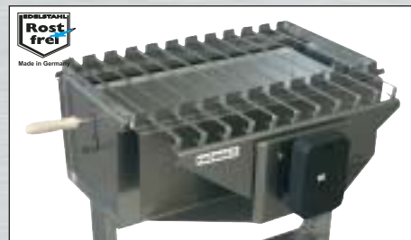
Motorbetriebener Spießaufsatz Edelstahl

Art.-Nr. D 3060 E EAN-Nr. 4021899 30004 6 / VPE 1